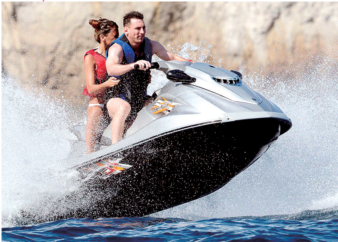
梅西正和女友度假,无暇顾及官司