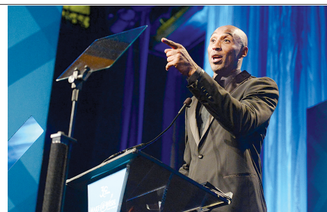
科比举手投足已具商业领袖风范。

据美国《洛杉矶时报》日前报道,湖人当家球星科比花580万美元买下了位于加州纽波特海滩附近的一处地产,计划将此作为科比公司的总部大楼。科比在接受美国几家权威媒体采访时均透露将于2016年退役,如今他正在为退役后经商做积极准备。美国ESPN报道说,在去年养伤期间科比就注册成立了以自己名字命名的科比公司,此前他还经常向苹果设计师、耐克CEO等知名人士取商业经,目前他的公司已经进行了第一笔投资,项目是新兴运动饮料。