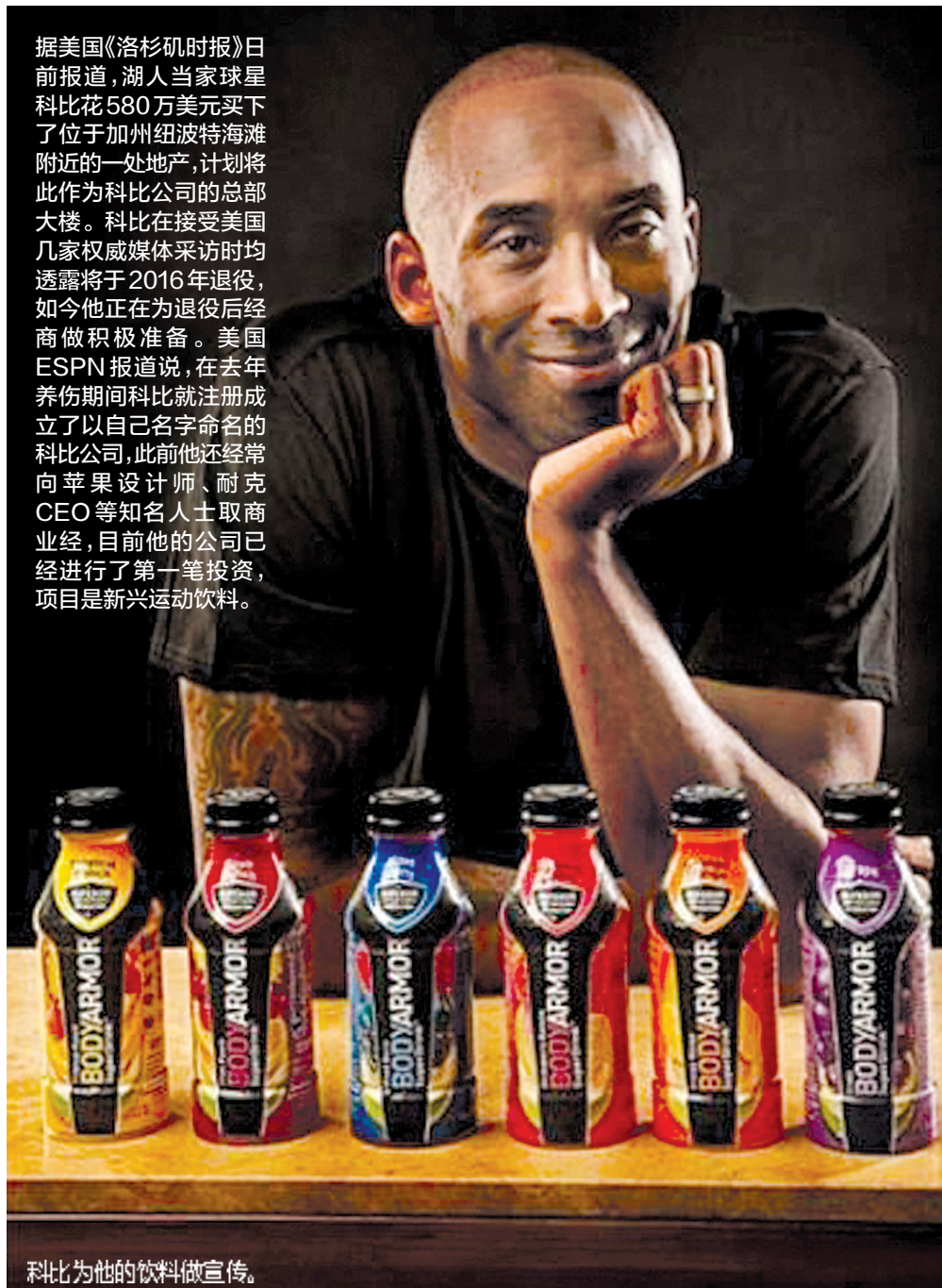
科比为他的饮料做宣传。

据美国《洛杉矶时报》日前报道,湖人当家球星科比花580万美元买下了位于加州纽波特海滩附近的一处地产,计划将此作为科比公司的总部大楼。科比在接受美国几家权威媒体采访时均透露将于2016年退役,如今他正在为退役后经商做积极准备。美国ESPN报道说,在去年养伤期间科比就注册成立了以自己名字命名的科比公司,此前他还经常向苹果设计师、耐克CEO等知名人士取商业经,目前他的公司已经进行了第一笔投资,项目是新兴运动饮料。