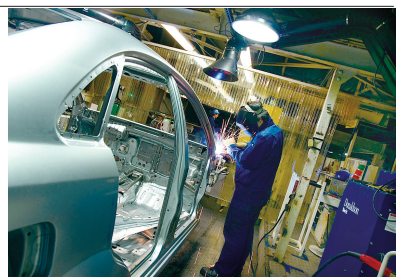
上海通用汽车金桥北厂车身车间