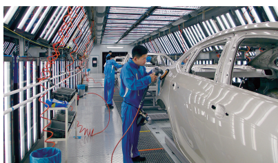
上海通用东岳汽车北厂油漆车间