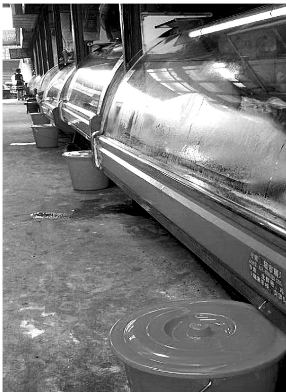
岗刘粮油蔬菜市场内,一家一个垃圾桶成风景。