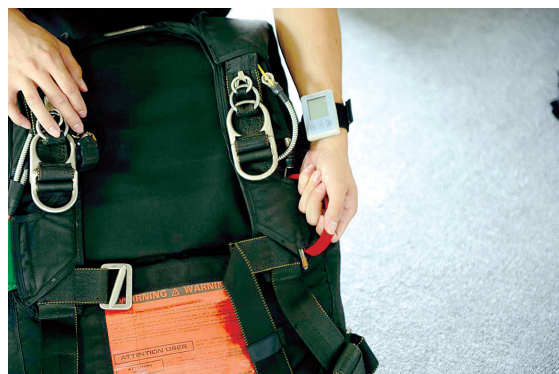
第一级是红色的拉环;黄色的小球是第二级措施;最后一个防护就是这个带有液晶显示的小玩意。