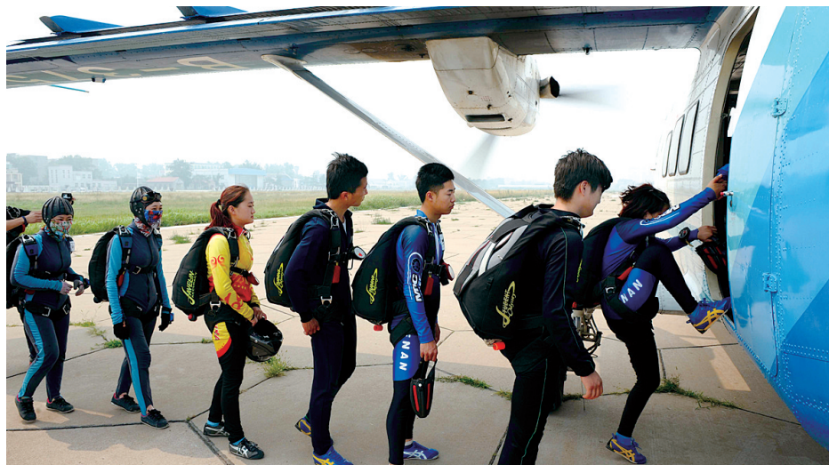
队员们排队登机等待“降落”。