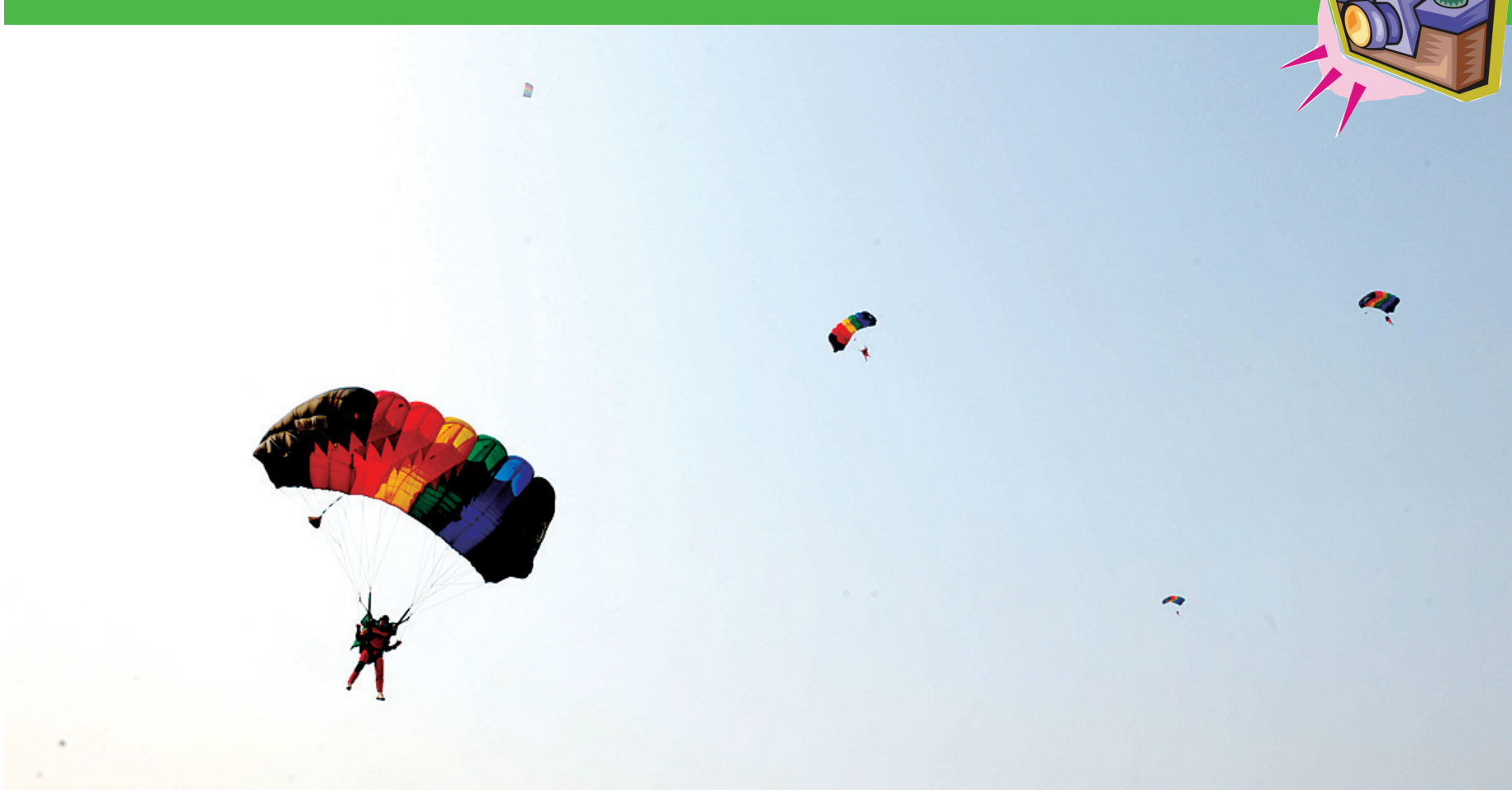
纵身一跃,融入在蓝天白云之中。