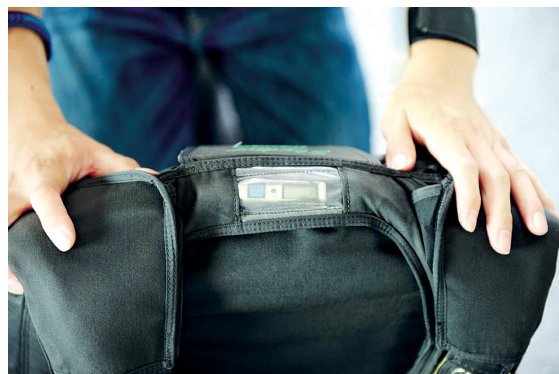
这个小家伙会探测高度和自由落体的速度,如果始终自由落体降落在一定高度时,会自动打开伞包。