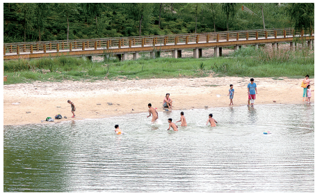
西流湖化工路桥下,多人在游泳。

昨日,本报报道了郑州东区一起溺亡事故,这已经是今年市区媒体报道的第八起溺亡事故了,而郑州危险水域最多在西郊,这些危险水域威胁着青少年的安危,离开学还剩20多天,本报再次发布危险水域图,希望家长及时告诫孩子,珍爱生命,远离危险水面。