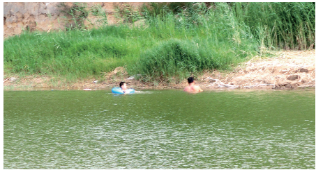
西流湖芦苇荡里,别玩水。