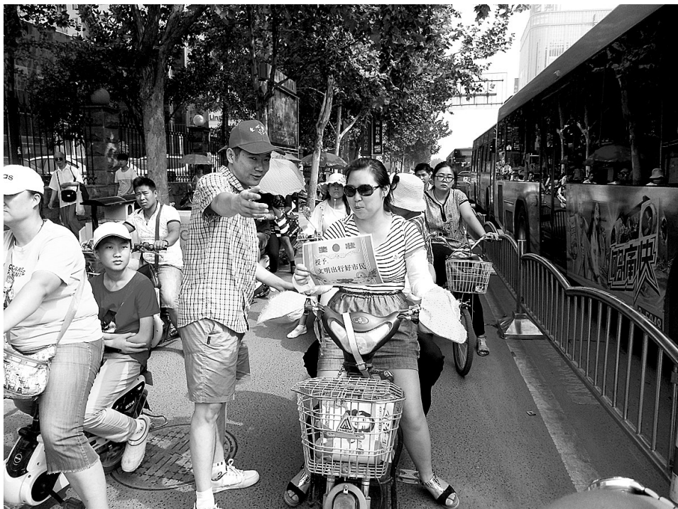
给不闯红灯的电动车主发奖状