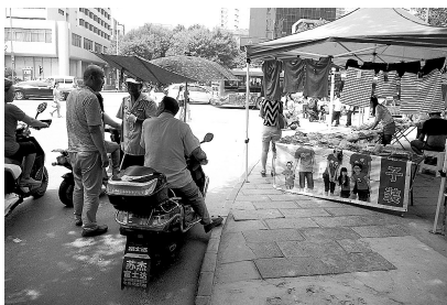
花园路丰产路口人行道上的占道摊点