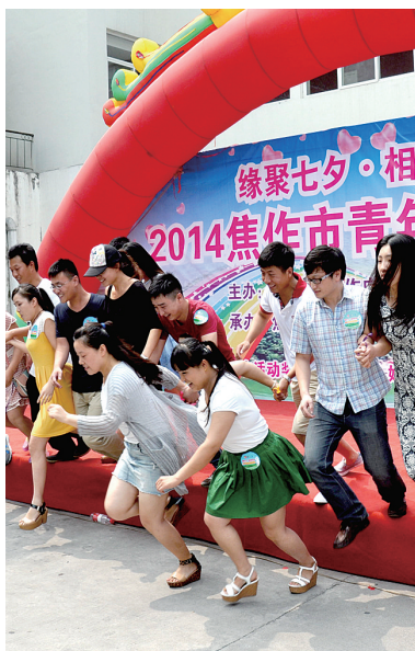
青年联谊会活动环节众多

景区在七夕节期间针对情侣、夫妻以及金婚伴侣推出的一系列优惠举措在市场上引起良好反响,吸引了大量游客的积极关注与热情参与,活动现场热闹非凡。