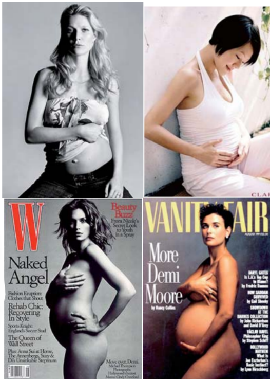
明星怀孕照排排站,肚大的看上去要美过肚小的。