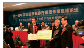
痔瘘规范诊疗示范医院