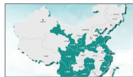
真正实现全国连锁品牌