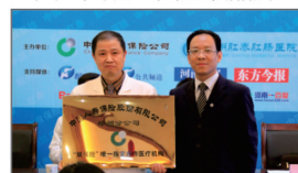
“肛泰-人寿双保险”保障