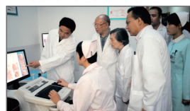
独有专病诊疗模式