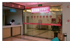
省内首家女子诊疗中心