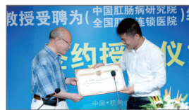
痔科国宝受聘为名誉院长