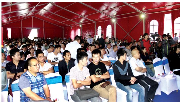
在等候区等待的认筹客户