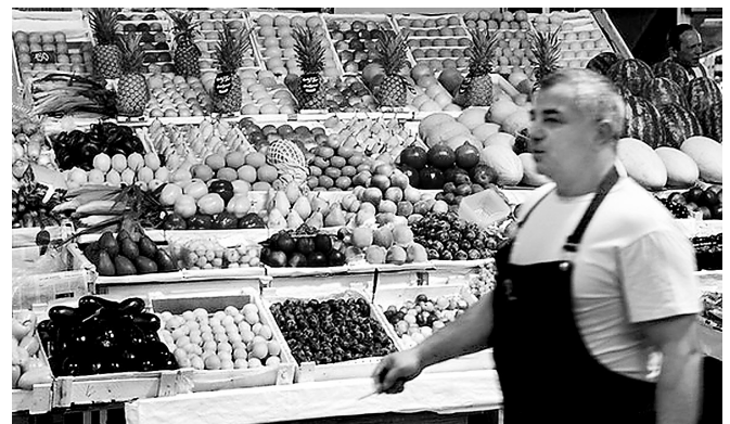
经济制裁前,俄罗斯的一家蔬果店。

欧盟将在周四举行会议,评估俄罗斯对于欧盟农产品制裁措施可能的影响。多个欧盟成员国已经表示,它们的经济将会遭到严重打击,其中德国和波兰将会失去与俄罗斯的大部分贸易额,而立陶宛、拉脱维亚和爱沙尼亚等波罗的海国家预计会有更大幅度的国内生产总值损失。据中新网