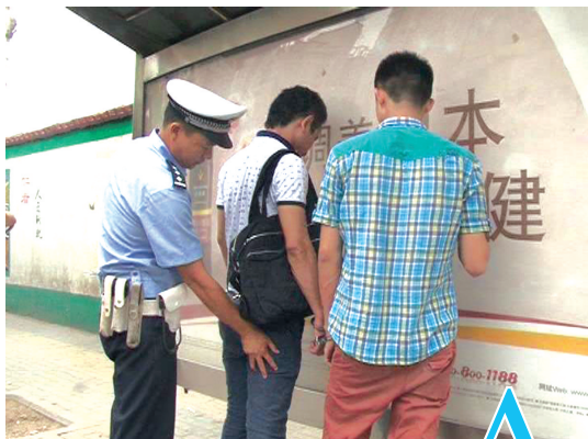
民警控制两名嫌疑人

16日上午,秦岭路建设路口附近的公交车站,一辆126路公交车进了站但就是不开门。原来乘客抓住俩小偷,怕小偷跑掉,司机征求乘客意见后,不开车门,等警察来。