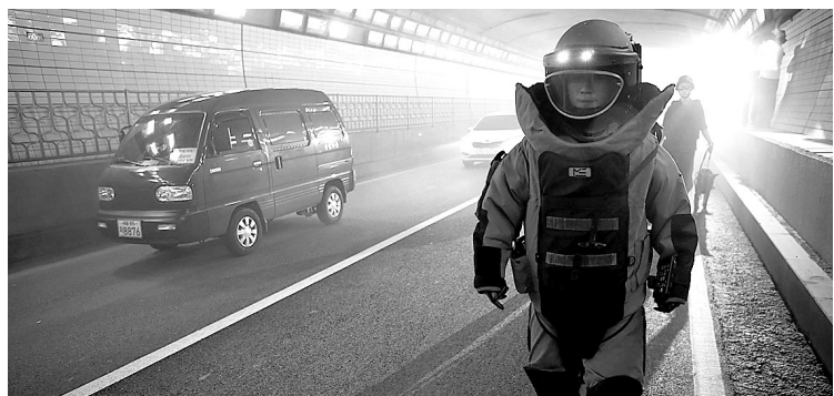
在韩国首尔,一名特别武器和战术外人员参加演习。

韩国和美国18日开始“乙支自由卫士”年度联合军事演习,以检验和提高双方的联合防御态势。这次演习将持续至本月29日。