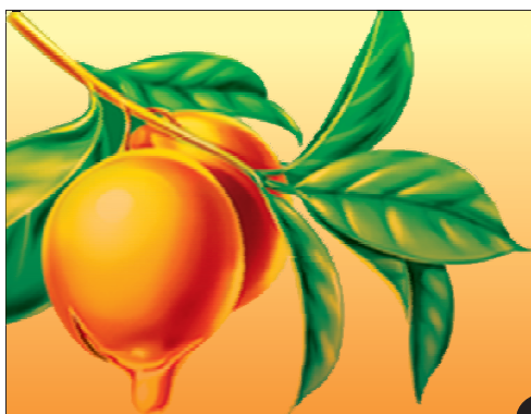
Camellia oil 油茶籽油

近年来，河南提出建设“文明河南”，做文明人办文明事。不仅设立从村镇到省各级先进模范人物的评选，提升公民道德素质，同时非常注重对好人的弘扬和帮扶，营造崇尚先进、见贤思齐的社会风尚。河南各地探索建立好人回访和扶助长效机制，对生活困难的好人提供政府救济和社会救助，在就业、生活保障、子女入学等方面给予照顾。河南省文明办副主任赵云龙曾受委托给“最美奶奶”彭秀英送慰问金，“其实人已经不在，但村里人能看到，社会没有忘记她。”