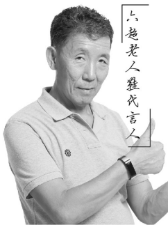
六超老人健走鞋代言人

三年前,我参与研发这款健走鞋,今天,它正式面市了。这是六超老人鞋再度升级之作,这双健走鞋,它相当于专业健走鞋+养生保健鞋+专业老人鞋,不仅有老人鞋的“舒适、透气、防滑、耐穿、防摔”优势,还具备健走养生鞋的养生保健功能。