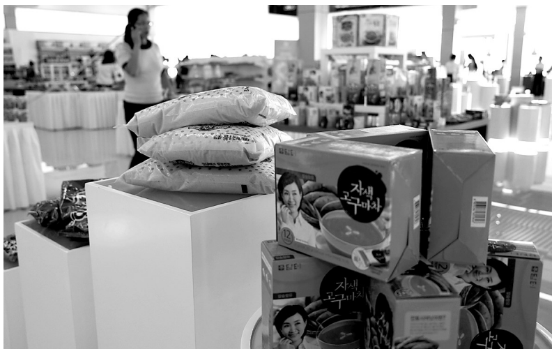
市民在郑州就可以挑选到称心如意价格便宜的国外商品。