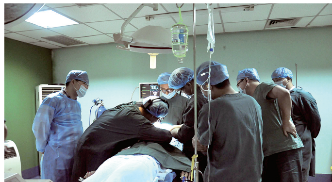
庞大的手术专家团队

觉动刀子是挺大的手术,现在看来是自己吓自己,现在的整形技术都是微创的,也是绿色自然的,所以姐妹们,想变美加油吧!