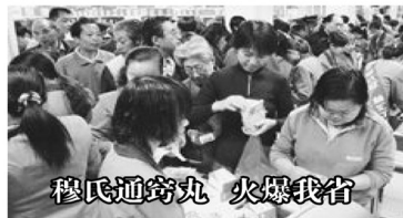
穆氏通窍丸 火爆我省

穆氏通窍丸一上市就受到耳聋耳鸣患者热捧!从来就没有一个产品能像穆氏通窍丸一样,一吃下去,当天消耳鸣,7天听见,一月听清。穆氏通窍丸风头盖过所有的耳病药。