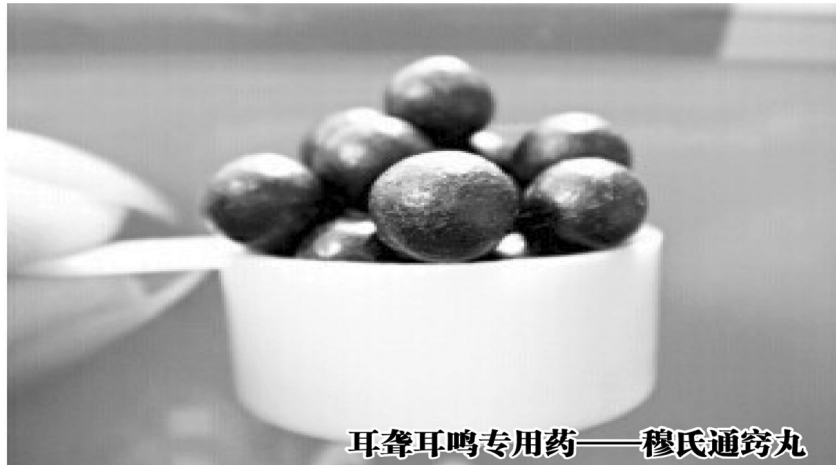
耳聋耳鸣专用药——穆氏通窍丸

据全国37家大型三甲医院的临床报告显示,穆氏通窍丸对感音神经性、药毒性耳聋,及老年性、混合性耳聋耳鸣等症有特效,