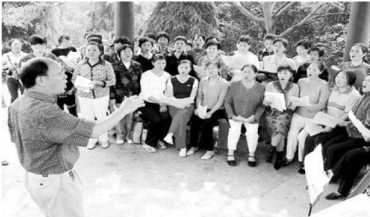
耳聋耳鸣康复明星放声歌唱