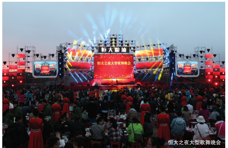
恒大之夜大型歌舞晚会