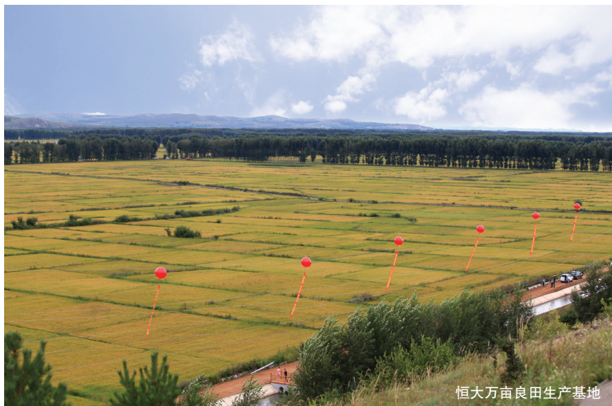
恒大万亩良田生产基地

有了天时、地利、人和等多方面因素的保证,恒大2015年将进入“夯实基础、多元发展”第七个“三年计划”,并有望跻身世界500强。