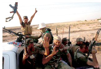
伊拉克政府军保护大坝

美国国防部7日说,为防止“伊斯兰国”武装人员夺取伊拉克第二大水坝哈迪萨大坝,美军当天在伊拉克逊尼派“核心地带”安巴尔省实施空袭。