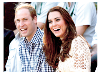
9月8日,英国王室宣布,凯特王妃确认再度怀孕。2013年7月22日,凯特王妃长子于伦敦出生。