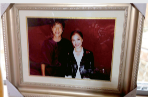
刘翔与葛天相识于2009年，此为刘家摆放的两人当时合影

“以前老是有人说上海男人娘娘腔、只会做家务、怕老婆，我也是想证明一下，其实上海男人很好，怕老婆不是坏事，做家务也挺好的，所以说上海男人是典范嘛。”——作为土生土长的上海男人，刘翔也毫不忌讳“怕老婆”的传统