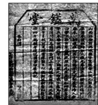
介绍郭忠谥丸的清代万谥堂印票