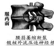
腰筋萎缩断裂 髓核外流压迫神经根