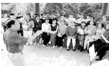
耳聋耳鸣康复明星放声歌唱