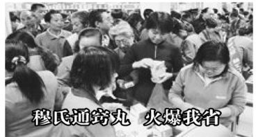
穆氏通窍丸 火爆我省

穆氏通窍丸一上市就受到耳聋耳鸣患者热捧!从来就没有一个产品能像穆氏通窍丸一样,一吃下去,当天消耳鸣,7天听见,一月听清。穆氏通窍丸风头盖过所有的耳病药。