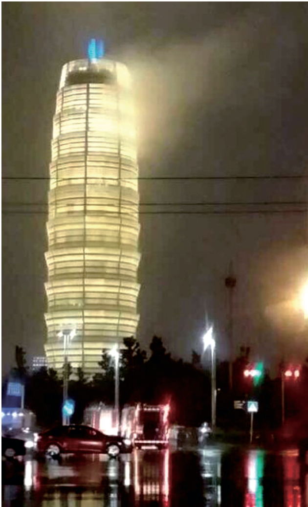
网友发图问“大玉米”着火了吗?