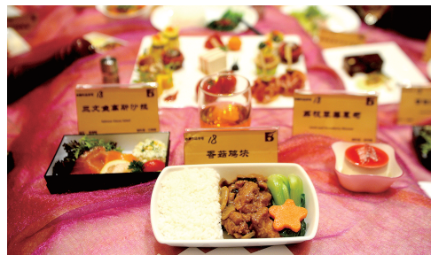
色香味俱全的参赛作品

说起飞机餐,大多数人都会用“难吃”评价,其实,飞机上也有美食!在昨日举行的第三届航空美食厨艺大奖赛、航空食品配餐展示会上,来自郑州、青岛、云南等68家航空食品公司和机场配餐公司云集新郑,100余名厨师展开美食的较量。