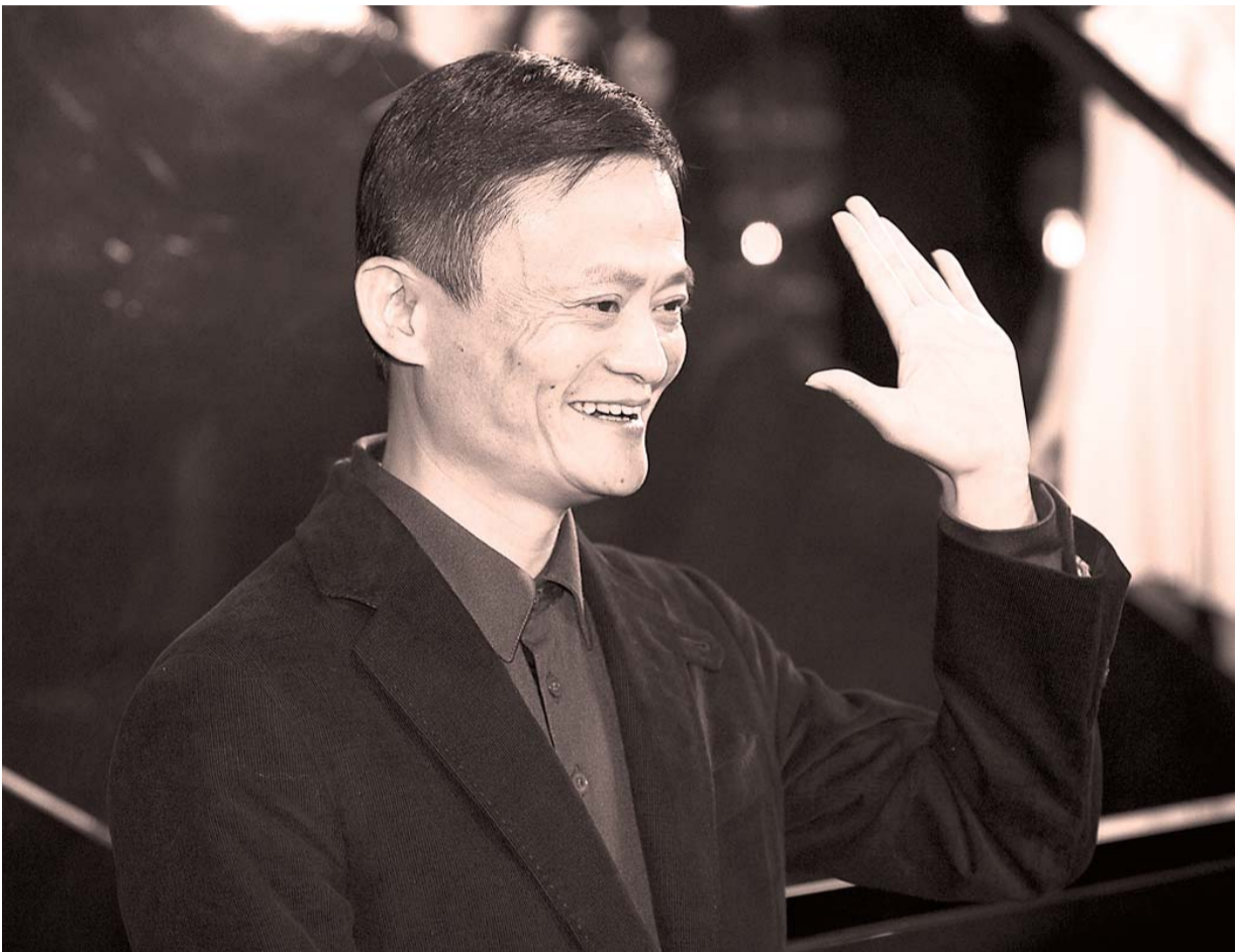
阿里巴巴昨天在香港路演,马云现身。