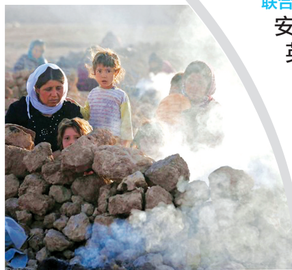
2014年8月，伊拉克B ajedK adal难民营，受极端武装所迫流亡的雅兹迪教派民众在荒地中做饭。

声明说，“伊斯兰国”持续的野蛮行径坚定了安理会成员的决心，即包括该地区在内的各国政府、各机构必须共同打击“伊斯兰国”、“支持阵线”及其他所有与“基地”组织有关的个人、团体等。安理会再次要求武装冲突各方全面遵守国际人道主义法，保护和尊重所有人道主义工作者；要求“伊斯兰国”、“支持阵线”及其他一切与“基地”组织有关的个人、团体等，立即无条件、安全地释放被其扣押的人质。新华社