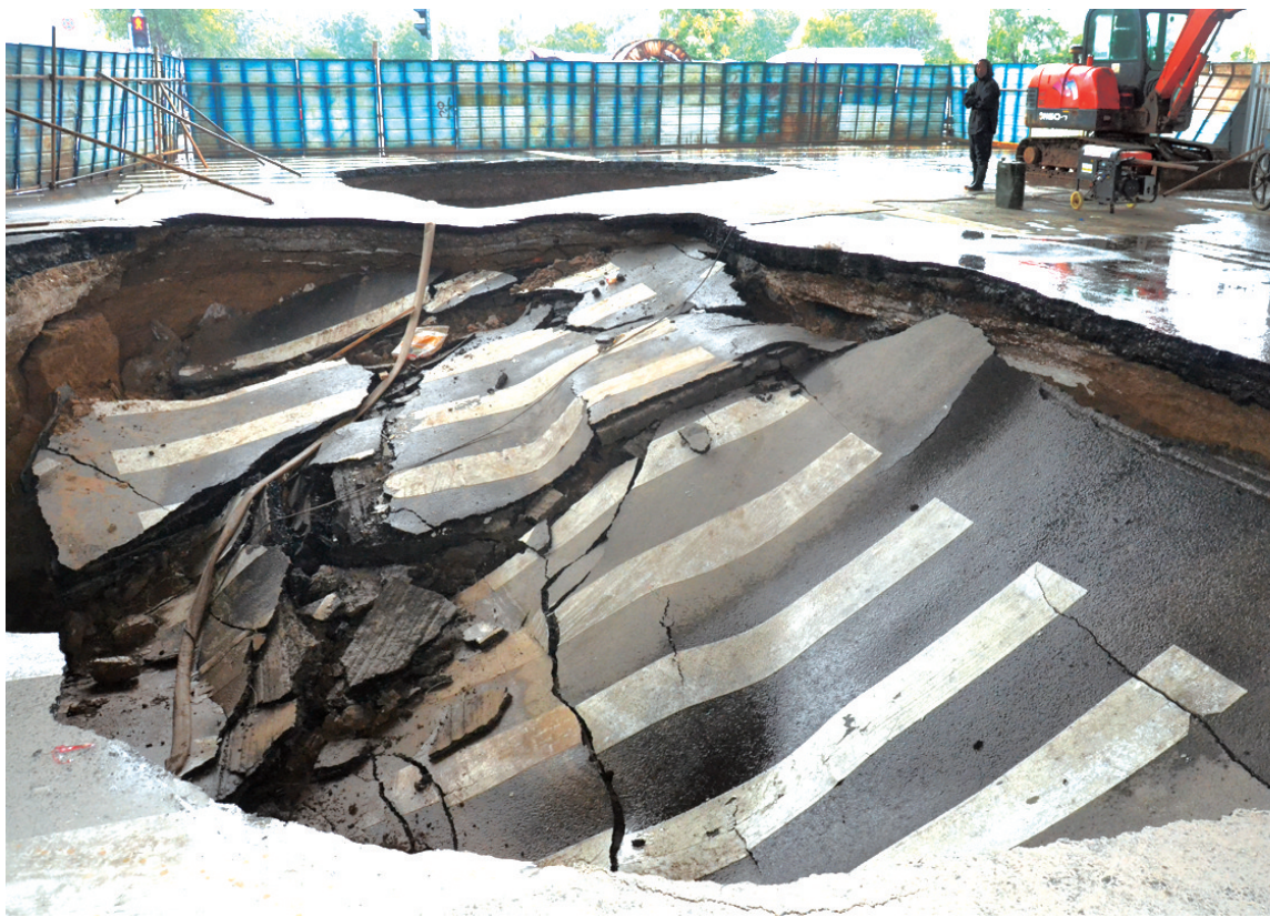
西三环塌方,水抽完等开工。