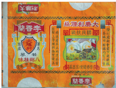
烟标上有“国民抗战”4个大字