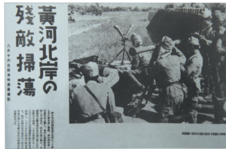
珍贵的老照片:日军在黄河北岸扫荡