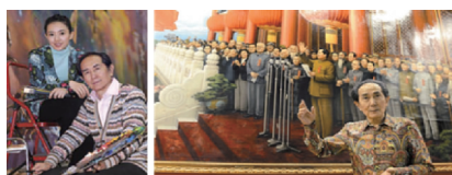
刘宇一和其女儿刘浩眉共同创作《开国盛典》, 右图为刘宇一在给观众讲解创作过程。

刘宇一 被誉为“共和国首席画师”, 连续三年创华人作品拍卖世界纪录, 作品《良辰》拍出 2300 万港币天价。