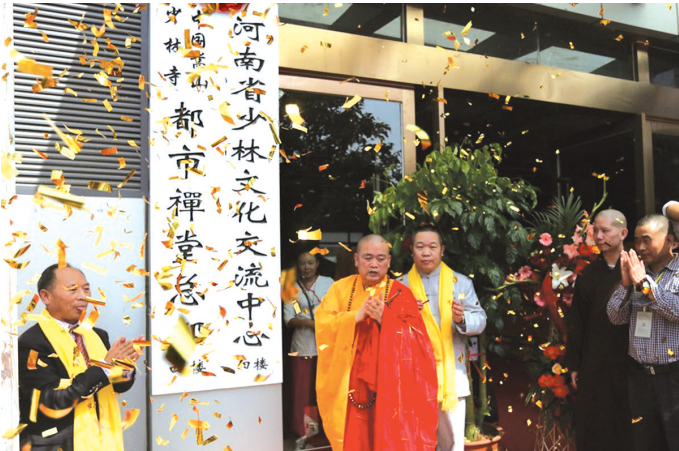
少林寺方丈释永信为河南省少林文化交流中心揭幕(资料图片)

在海外建立了数十家少林文化交流中心后,中国嵩山少林寺在国内开设了首家少林文化交流中心。