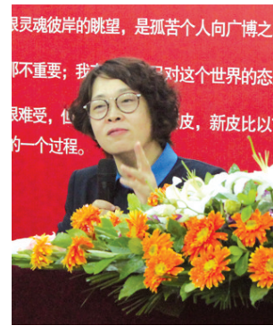
人物:张越,中央电视台节目主持人。长期主持《半边天》、《夜线》等栏目。2006年度获得“优秀播音员主持人”荣誉称号。