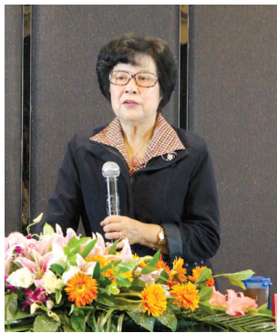
人物:陈一筠,1964年毕业于北京大学,中国社会科学院研究员、青春期健康与情感教育专家,中国性学会青少年性教育专业委员会名誉主任,中国婚姻家庭研究会专家委员会副主任。