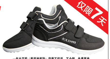
一年内开胶/断底换新鞋！穿着不舒服，不合脚，免费更换