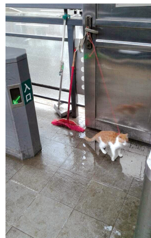
棉纺路站台被遗弃的小猫