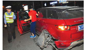
红色路虎左后轮被撞报废

22日晚10点50分左右,一辆黑色别克撞上一辆红色路虎,别克头部“开了瓢”,路虎被撞“瘸腿”,左后轮报废。别克驾驶位下来一男子逃跑时,被路虎车主当场抓住。面对交警询问,男子承认喝多了,但说是坐朋友的车,而路虎车主认准对方就是肇事司机。