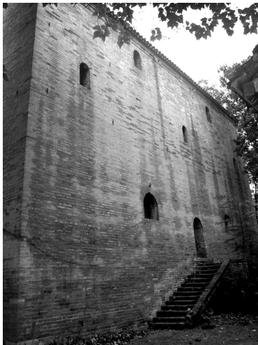
程家大院绣楼外貌