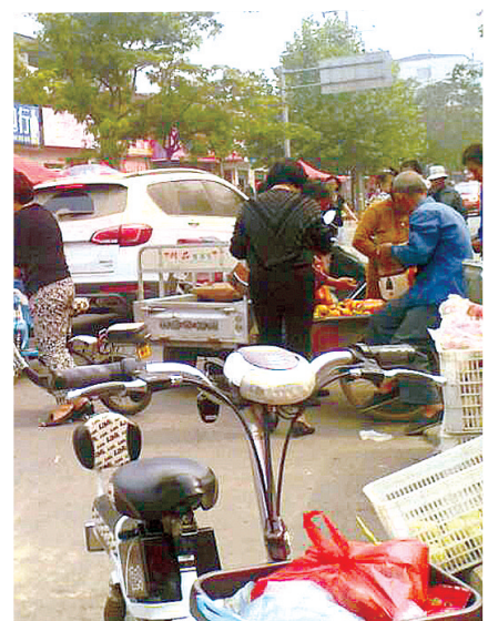
“大坑”中的成皋路“肠梗塞”现象严重