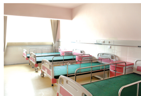
爱馨养老集团护理住房