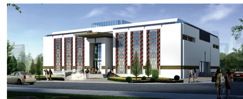
爱心阳光城银龄博物馆

截至目前,郑州市共发展“银龄之家”居家养老服务中心20个,服务老人达一万多人次,开展居家养老、科普教育、幸福联谊、文艺比赛、义诊等志愿者活动近千次,得到了社区老人的赞许和认可,吸引了各地养老机构参观学习。预计2015年将建成400个“银龄之家”,覆盖全市60%以上的社区。