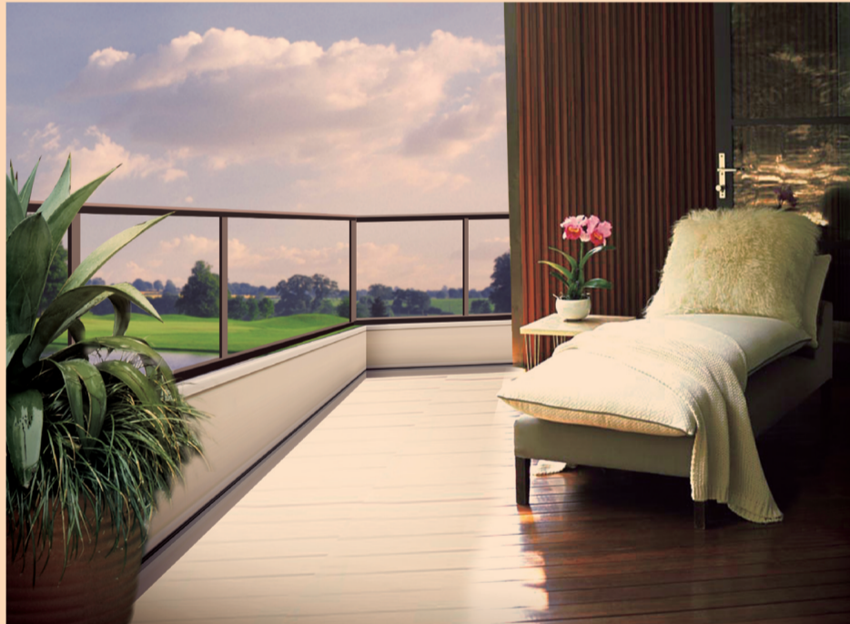
自在·中央优居 / 优雅·人文学区 / 浪漫·法式格调 / 精致·智能生活 / 高贵·罕有纯板