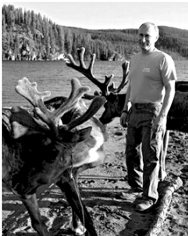
普京的假日总是引人关注 资料图片

今年10月7日是俄罗斯总统普京62岁的生日。其新闻秘书佩斯科夫表示,普京在远离居民点的西伯利亚原始森林迎接生日。