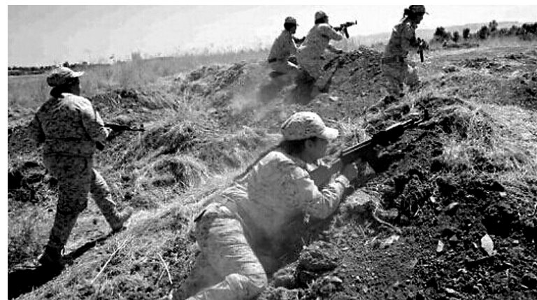
库尔德女战士与极端武装战斗中

一名叙利亚库尔德女战士5日在靠近土耳其的边境重镇科班抵抗极端组织“伊斯兰国”时引爆炸药,与敌人同归于尽。