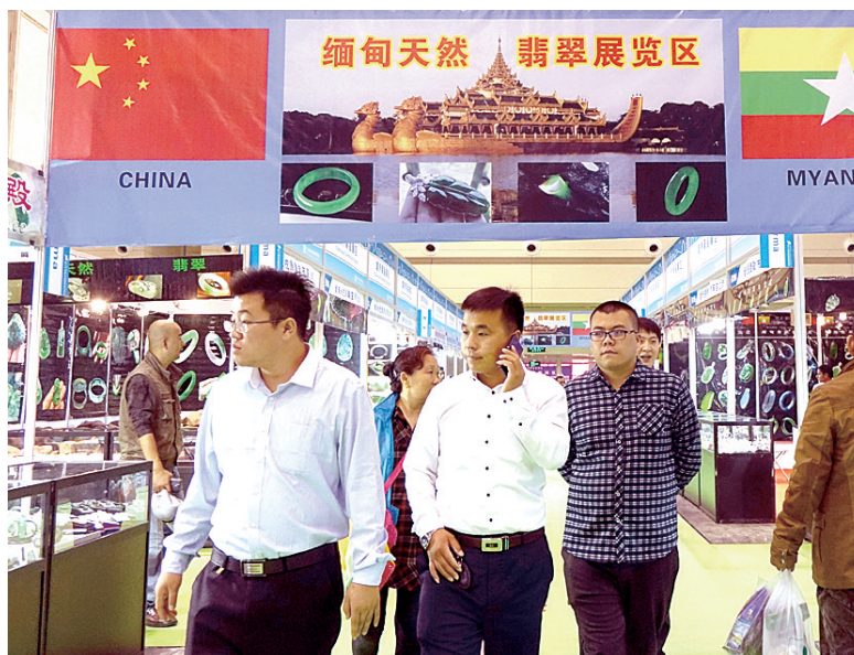
本届郑交会吸引了众多国外企业参展。

本届展会为广大参展企业提供在线宣传服务,通过郑交会合作网络——惠展网实现了网上预订展位、专业观众网上登记及各种服务项目预订等功能。郑交会网络平台的开通,提高了服务质量,提升展会形象。