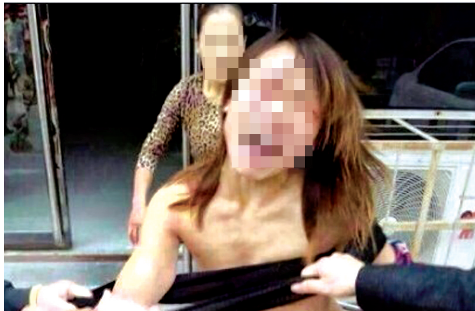
原图为全身照片,本报作裁剪处理。

疑为原配女子率众群殴小三,当街扒光致其三点全露。10月10日上午,在濮阳县老城发生的这一幕劲爆场面,被网友上传到了微博、论坛上,引发众多网友热议。 郑州晚报记者 石闯 潘登