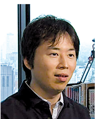
作者岸本说结局早已设定好了。

一部漫画画了15年,漫画家是怎么想的?他对自己笔下的角色有什么看法,未来是否会对他们有新的漫画任务安排?漫画完结后,他对自己接下来的生活又有什么安排?以下,是岸本齐史在不同时期接受日本杂志采访的一些片段。 问: 创作出一部享誉世界的漫画是什么感觉? 答: 哦,说实话,其实我没有感觉到它在世界上有多风靡。由于我有一系列的工作要做,都不怎么外出,都没注意这些。感觉这些都跟自己没什么关系。 问: 如果能回到最初创作的时候,你会给自己什么样的忠告和意见吗? 答: 大概会是这样吧,“嘿,把那些未来的想法提前吧,不然将来你就要有麻烦了。”(笑) 问: 什么是成为一位漫画家最