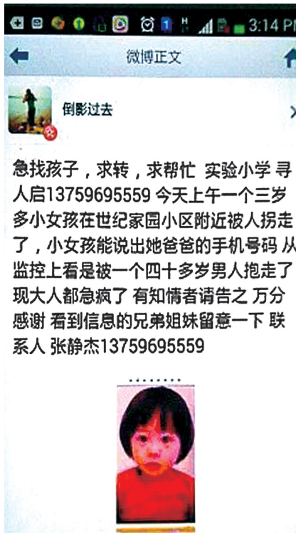
帖子里的小女孩其实是韩国一童星

近期,一则3岁小女孩在世纪家园小区附近被拐的消息,在微博里疯传,甚至一些明星、大V都在转发这个消息。后来有细心网友发现这么一个规律,就是在不少城市都流传着同样的消息,但永恒不变的都是“世纪家园”、“3岁女孩”、“被40岁男子拐走”……到底有没有这么个女孩?世纪家园到底在哪?公安部明确表明别再转这个寻人帖了,那是吸费电话。 郑州晚报记者 张玉东