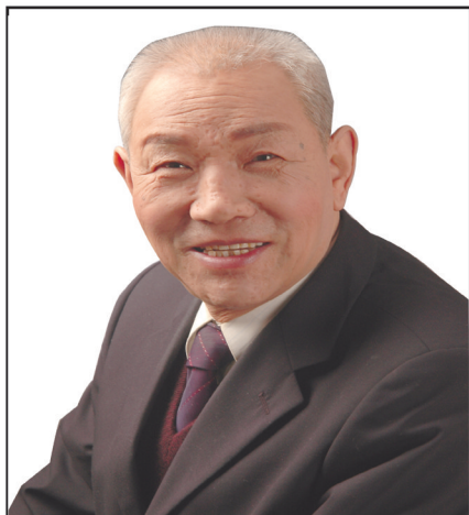
冯国柱 国防高级工程师 航天医学高级顾问 军威高新技术研究所所长 中国医师协会理事会副理事长