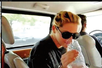
在真人秀节目里喝尿,钱婆蛮拼的。