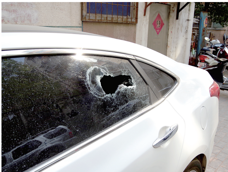
永安街35号院15辆白色汽车玻璃被砸