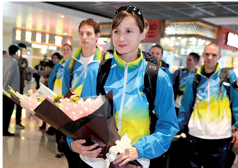
第十届中国郑州国际少林武术节首支国外代表团抵郑。

本报讯 第十届中国郑州国际少林武术节开幕在即,郑州再次成为世人瞩目的焦点。昨晚9点09分,参加武术节的斯洛伐克武术团队抵达郑州,这也是首支抵达郑州的国外武术团队。