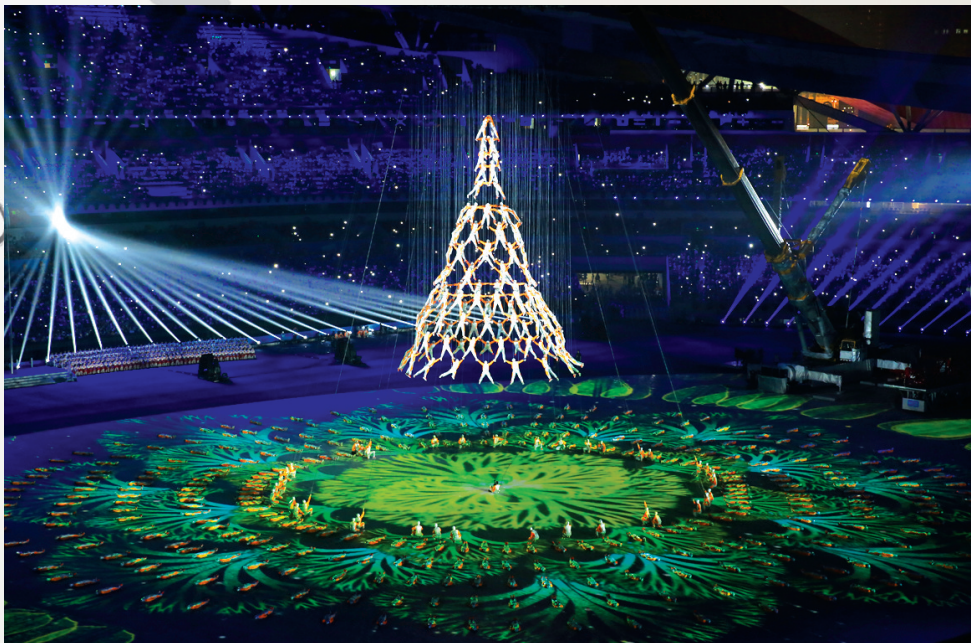
青奥会开幕式《筑梦之塔》