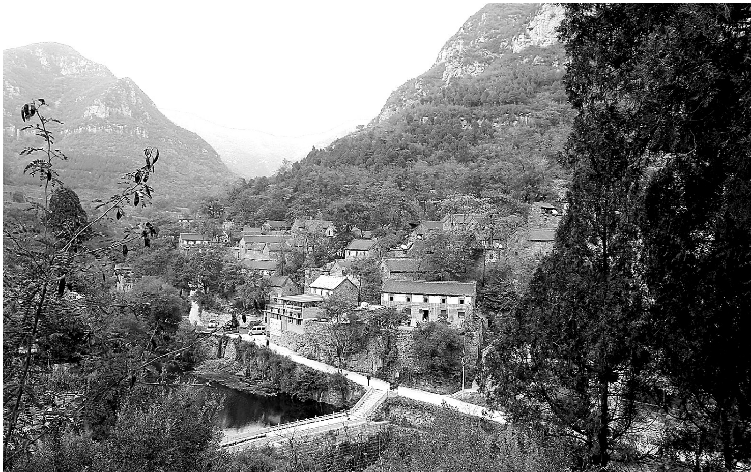
纣王殿村群山环抱