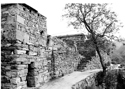
石头古宅依山而建